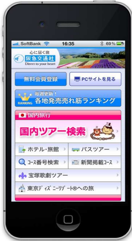
▲スマートフォン トップ画面

スマートフォン端末から阪急交通社旅行サイトにアクセスすると専用画面を表示します。