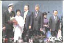
▲2004年 サファイア・プリンセス号 セレモニー